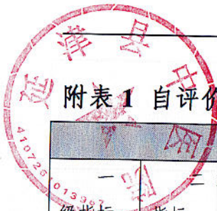
附表1 自我评价评分表