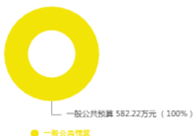
本年收入预算结构图

中国共产党延津县委员会政法委员会2025年收入合计582.22万元，其中：一般公共预算582.22万元；政府性基金预算0万元；国有资本经营预算0万元；财政专户管理资金收入0万元；事业收入0万元；事业单位经营收入0万元；上级补助收入0万元；附属单位上缴收入0万元；其他收入0万元；上年结转结余0万元。